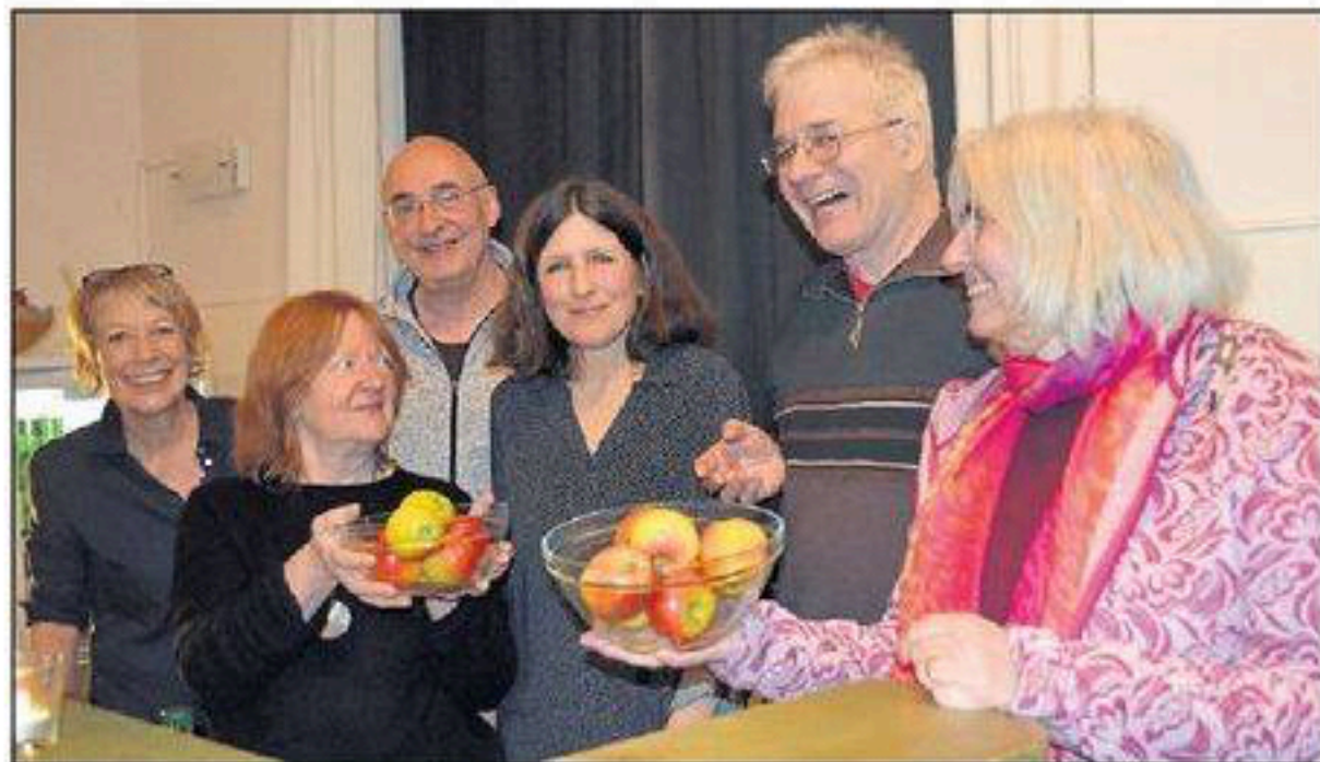
Das KuTa-Team „servierte“ zu Hollyfood Äpfel an der Bar.